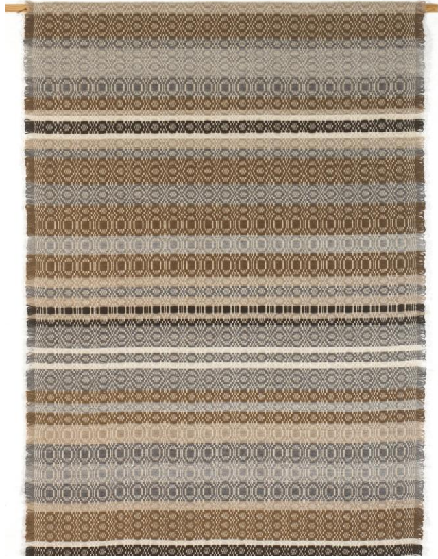
Nr 9 Åmotsdal-teppet