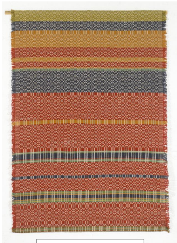
Nr 3 BILSTAD-TEPPET