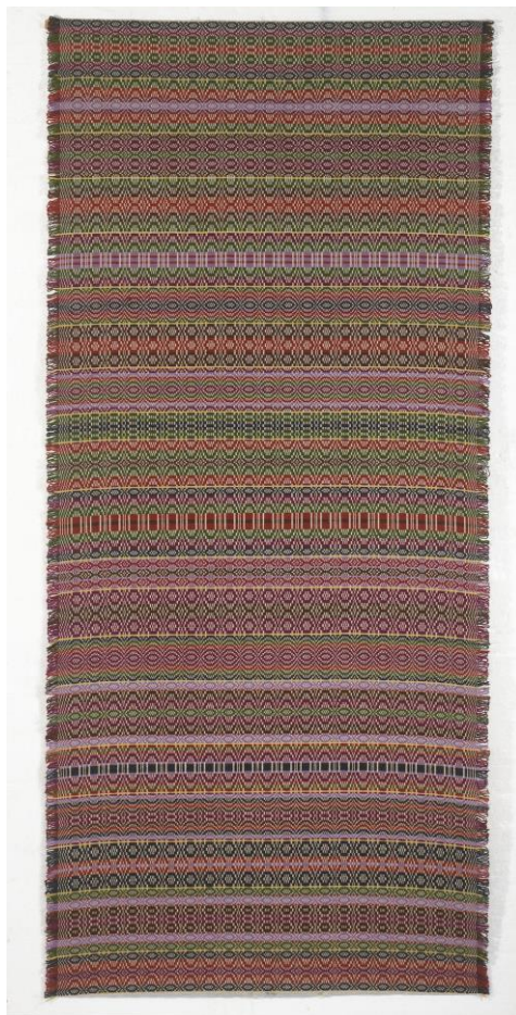
Nr 4 HUSTVEIT-TEPPET