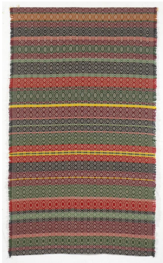
Nr 7 Vinjerui-teppet