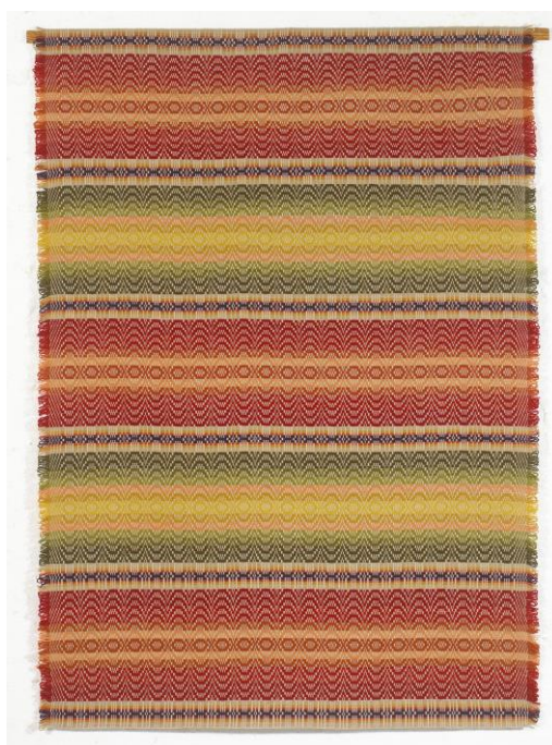
Nr 2 MOGEN-TEPPET