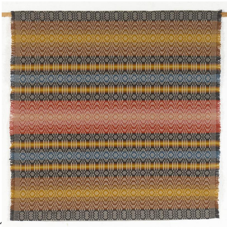
Nr 5 HUSO-TEPPET