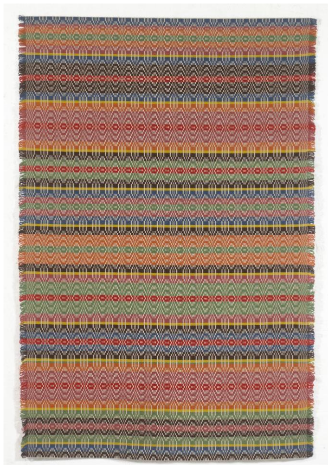
Nr 6 LÅRDAL-TEPPET